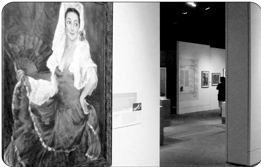
Obra realizada por el pintor Hernando Villa.