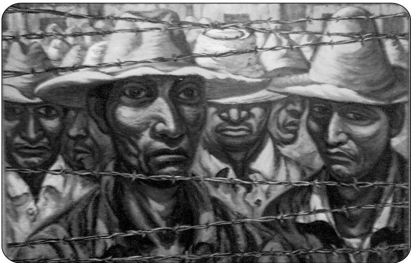
'Braceros', de Domingo Ulloa.